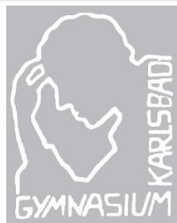
Karlsbad - Německo