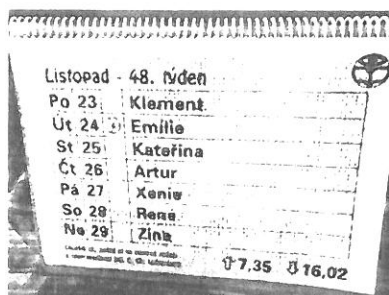
Kalendář pro nevidomé

Co všechno jsme poznali, viděli a mohli si i něco vyzkoušet: