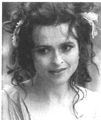
TeA* a KačQa