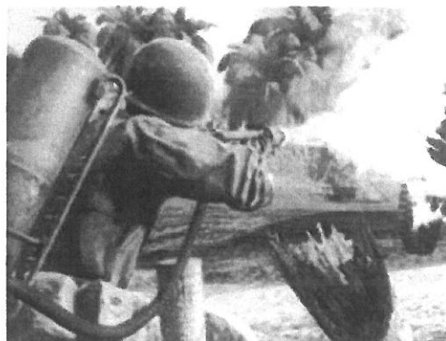
By Pavlas :)