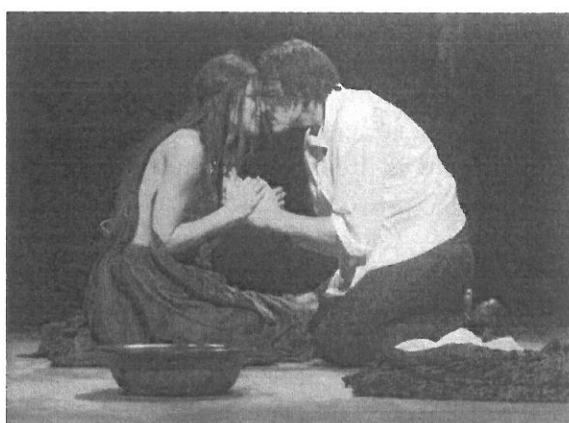
Lujko a Rada